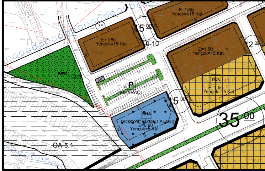
Harita 4. Planlama Alanının Mersin İli, Mezitli İlçesi, Mezitli Mahallesi, 146 Ada 2 Parsele İlişkin 1/1000 Ölçekli Uygulama İmar Planı Değişikliği Durumu

Mersin İli, Mezitli İlçesi, Mezitli 146 Ada 2 Parsele İlişkin 1/1000 Ölçekli Uygulama İmar Planı Değişikliği ile 146 ada 1 parselde İdaremizce halen inşaatı devam etmekte olan, Kültür Merkezinin kamu hizmetine sunulması sonrasında, bölgede oluşacak otopark ihtiyacının karşılanması için anılan parselin kuzeyinde yer alan, 146 ada 2 parsel üst ölçekli plan kararlarına uygun olarak “Otopark Alanı” olarak planlanmış olup, bunun dışında herhangi bir değişikliğe gidilmemiştir.