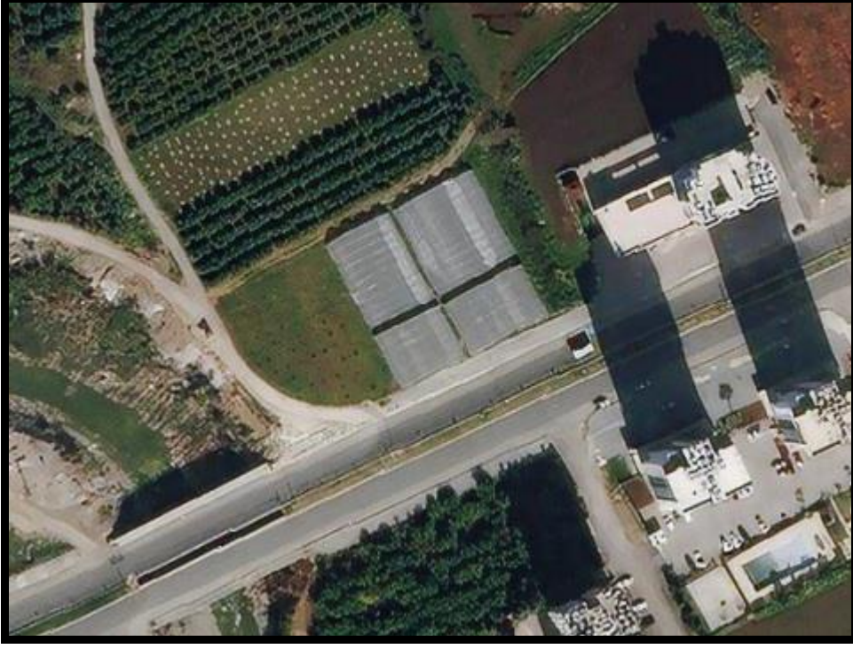
Harita 1. Planlama Alanının Uydu Fotoğrafı

1/1000 Ölçekli Uygulama İmar Planı Değişikliği'ne konu 146 ada 2 parsel Mezitli Sınırları içerisinde yer almakta olup, yaklaşık 0.24 hektar büyüklüğündedir.