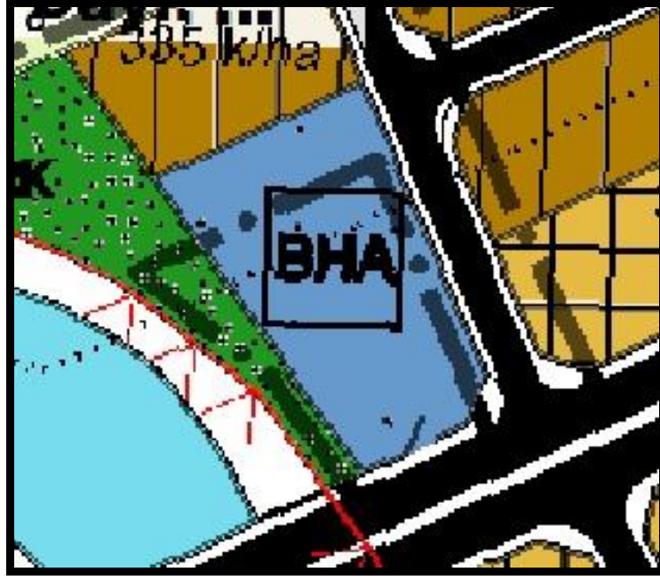
Harita 2. Planlama Alanının Akdeniz-Toroslar- Yenişehir-Mezitli İlçeleri 1/5000 ölçekli İlave ve Revizyon Nazım İmar Planı Durumu